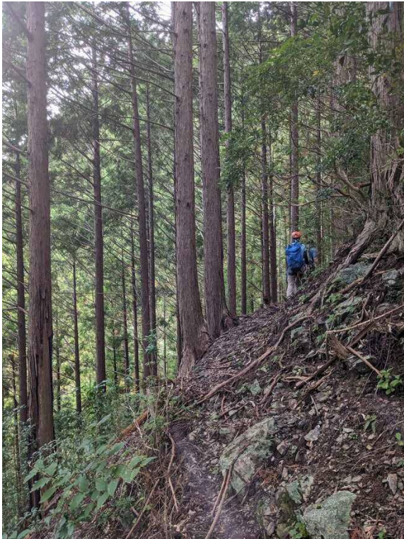
13:20 頃 作業道(?)を歩く