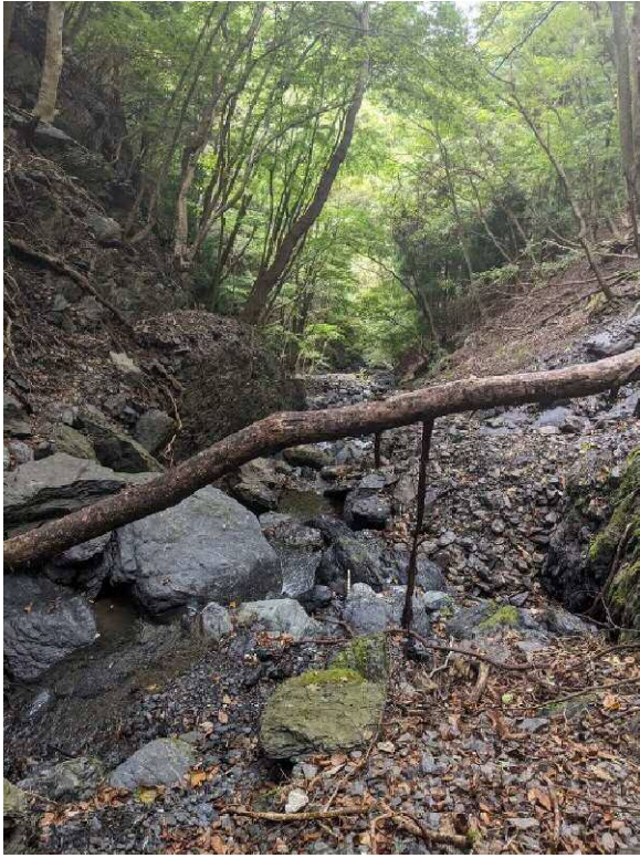
12:40 頃 沢の出会い