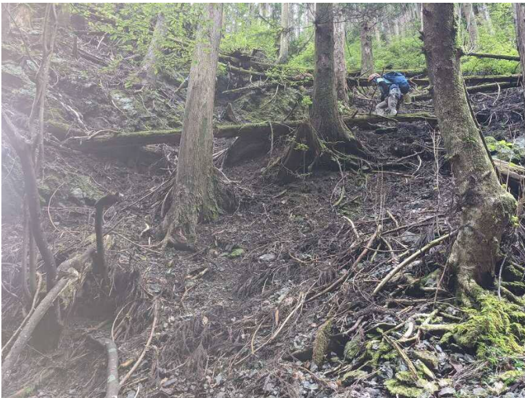
二つ目の沢を越えて、尾根に取り付く