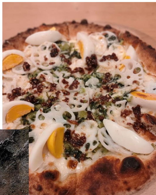
野沢菜と山葵ソースのピザ 旨かった 税込 1000円

6:45 オレンジ丸 → 9:00 駐車場 9:10 → 10:10 展望台 10:30 → 11:00 奇妙の滝入口 → 12:00 十八幅滝登攀開始 → 15:40 懸垂下降終了 → 16:30 下山開始 → 19:30 オレンジ丸