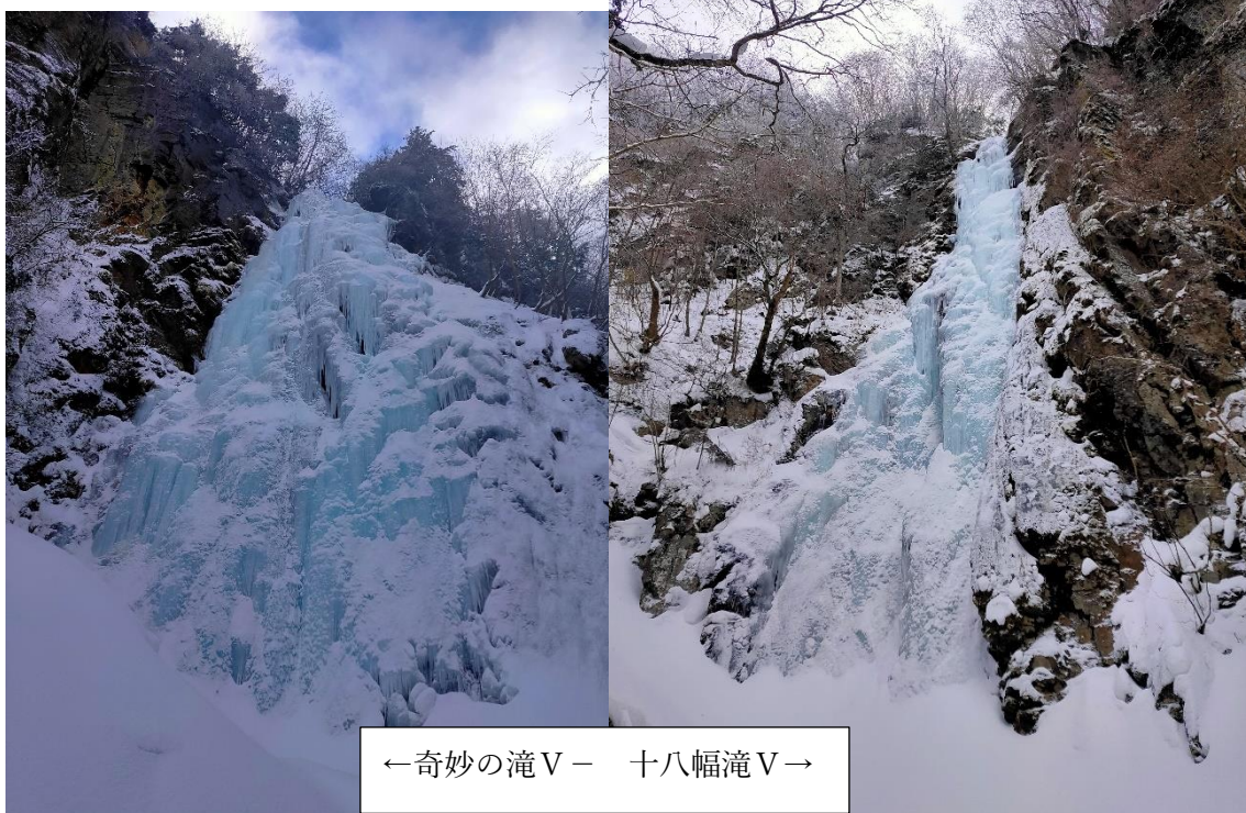
← 奇妙の滝 V - 十八幅滝 V →

まあ仮に例年通り発達していても、今の技術ではとても登れるとも思えない滝々だったので、林道を歩いて奇妙の滝へ。トレースのない林道を下ると奇妙の滝の折れた案内板が現れる。遊歩道を歩けば、奇妙の滝へ。途中で左へ折れると、十八幅滝へ。まずは十八幅滝を昼頃から登り始めた。