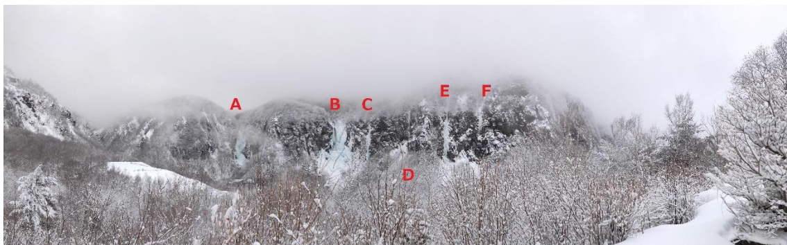
A から順に、権現滝（登攀禁止）、不動滝（登攀禁止）、黒滝、カチカチ山、正露丸、百草丸 黒滝は細く、カチカチ山は未発達。正直どれも登れる状態ではない。

ても、最高の景色であると断言できるほどだ。ただ写真で見る限り、今年の氷の状態は良くない。カチカチ山は未発達で登れる状態ではないし、不動滝も黒い水が流れているのが展望台から見ても分かったほどだった。日本全体では寒波に見舞われたシーズンではあったが、須坂市ではそこまでではなかったのだろう。