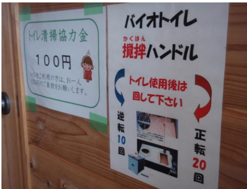
使用后、長さ 30cm ほどのハンドルをぐるぐる回す。