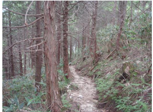
一気に下りたい所だが「ショートカット禁止」の札があちこちに掲げてある

小屋も見だし、山頂も暑くて体力を奪われるので下山を開始する。約 1 時間で分岐まで戻り、そこからは延々とつづら折りの山道を下る。これがまた長くて苦行の域。