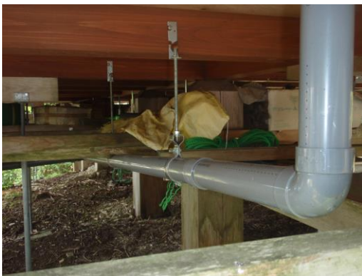
バイオ(おがくずとか?)で処理された物のうち、液体物は VU50 で建物外部へ排出するらしい