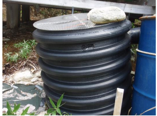
タンク内に活性炭が敷き詰められていた。