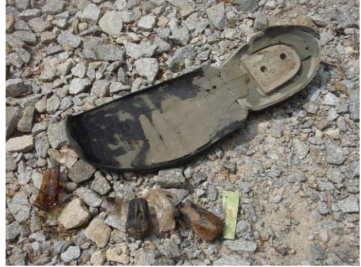
さすがにソールは気づくでしょうに

残された物からその人を想像することもなんだか楽しかったので(独りで暇だからか？或いは暑くて自身が壊れかけていたか？)、今後も続けていこうかなあと思う。