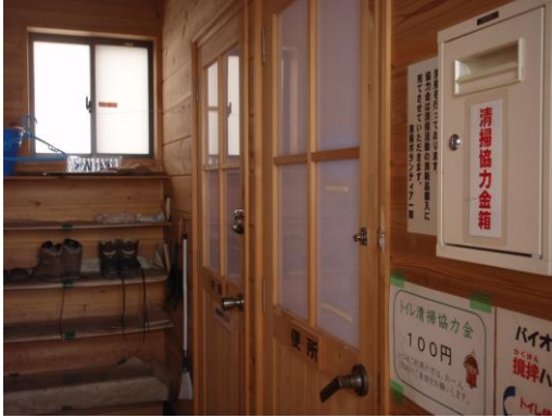
男子・女子トイレと分かれている