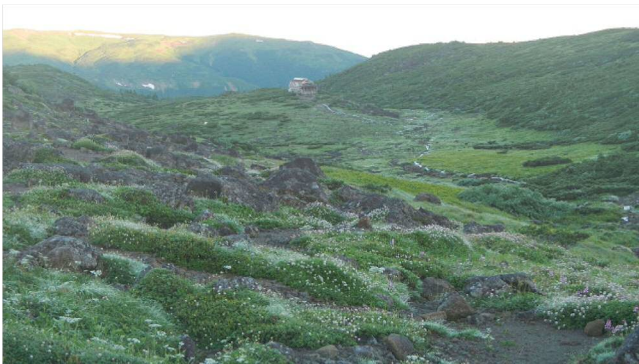
朝の雲ノ平。山荘が遠くに見える。