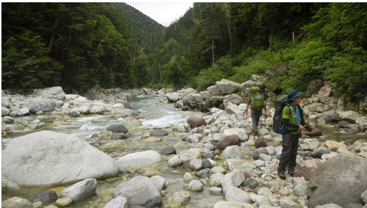
一旦、薬師沢に降りる。

雲ノ平の台地へは急な登り。濡れてヌルヌルした岩が多いので大変だった。やがて傾斜が緩くなってきてハイマツの中の道となり、木道が出てくる。所々にアラスカ庭園やらギリシャ庭園と地名がついている。やがて雨が降って来る。濡れた木道は滑り易い。特に下りは慎重に進む必要がある。