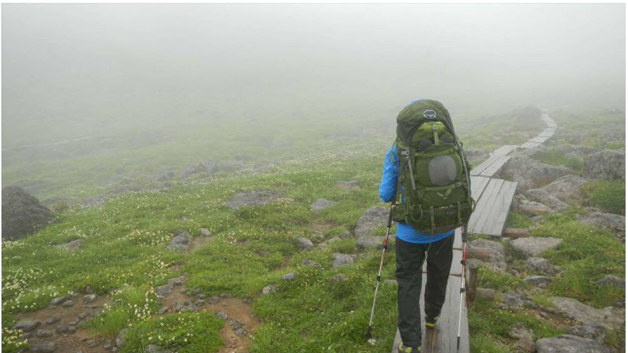
幻想的な雰囲気の中をキャンプ場に向かって歩く。小屋から約20分。