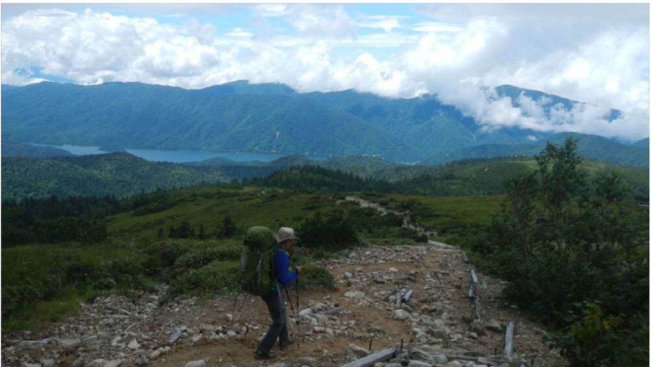
折立に向かって下る。有峰湖が見える。

予想通りに雨が降ったサブ計画の山行であったが、雲ノ平を十分楽しめた。いつかまた再訪したい。