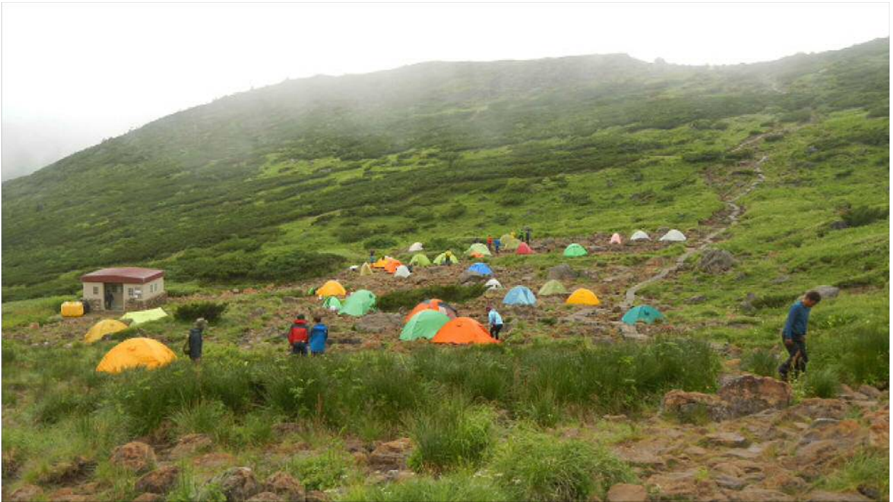
雲ノ平キャンプ場。岩が多く、平らで広い場所は少ない。

雲ノ平山荘でテントの受付をしてからキャンプ場に向かう。テントサイトに着くと既に30張りぐらいのテントがあった。このキャンプ場は岩が多くて平らな所が少ないので大きいテントを張る場所は非常に限られる。