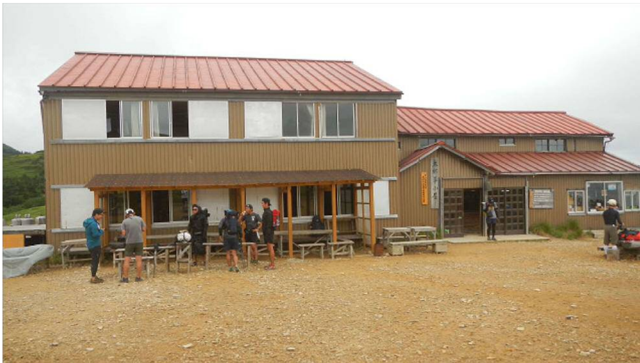
太郎平小屋。山岳警備隊の臨時派出所がある。