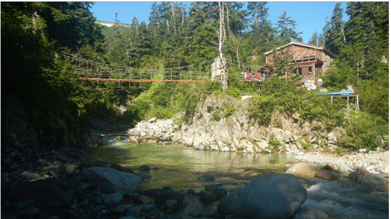
薬師沢小屋に戻って来た。見えているのは黒部川。