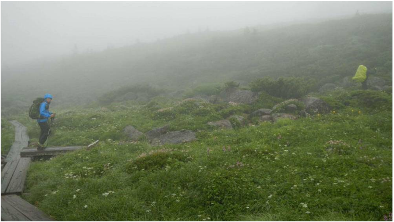
高天原への分岐に入る