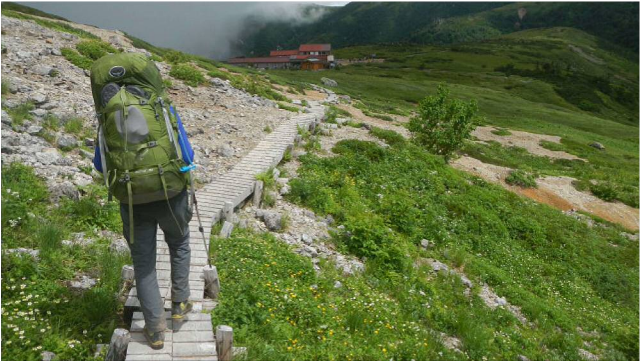
太郎平小屋が近づいて来た