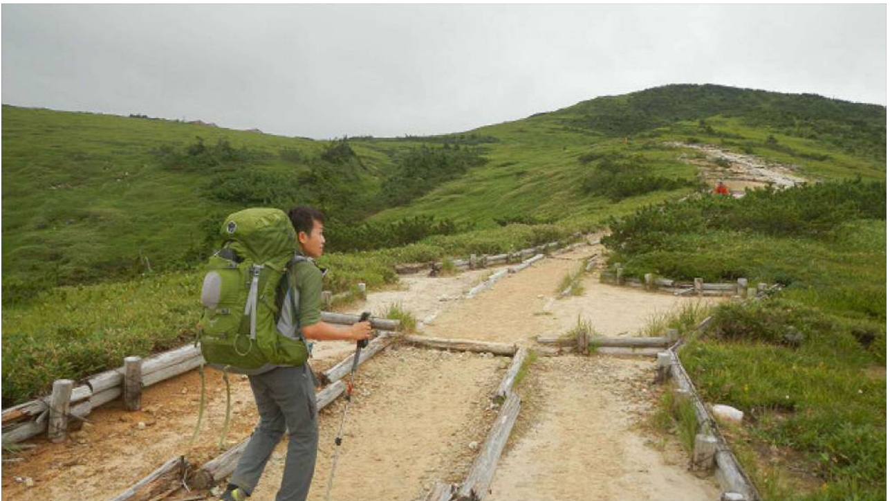
太郎平への緩やかな登り

太郎平から薬師沢に降りる。吊橋を渡って一旦沢に降りて少し歩くと雲ノ平への分岐がある。