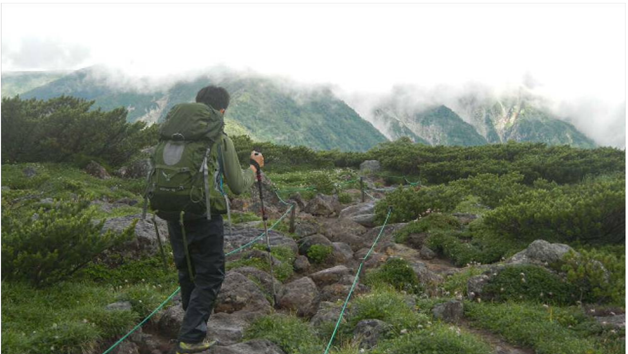
天候は回復してきたが、黒部川の向こうの薬師岳は雲がかかっている