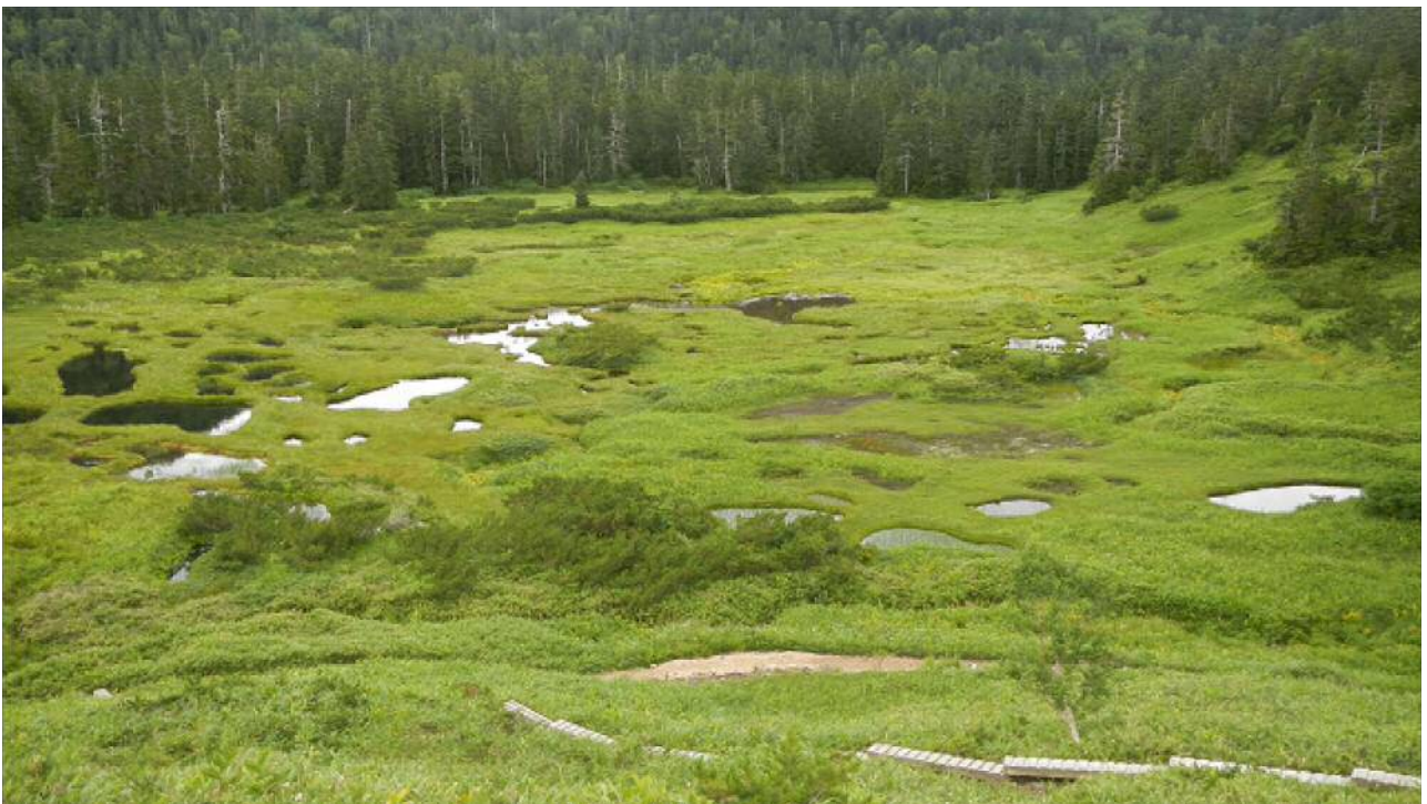
高天原山荘手前の湿原