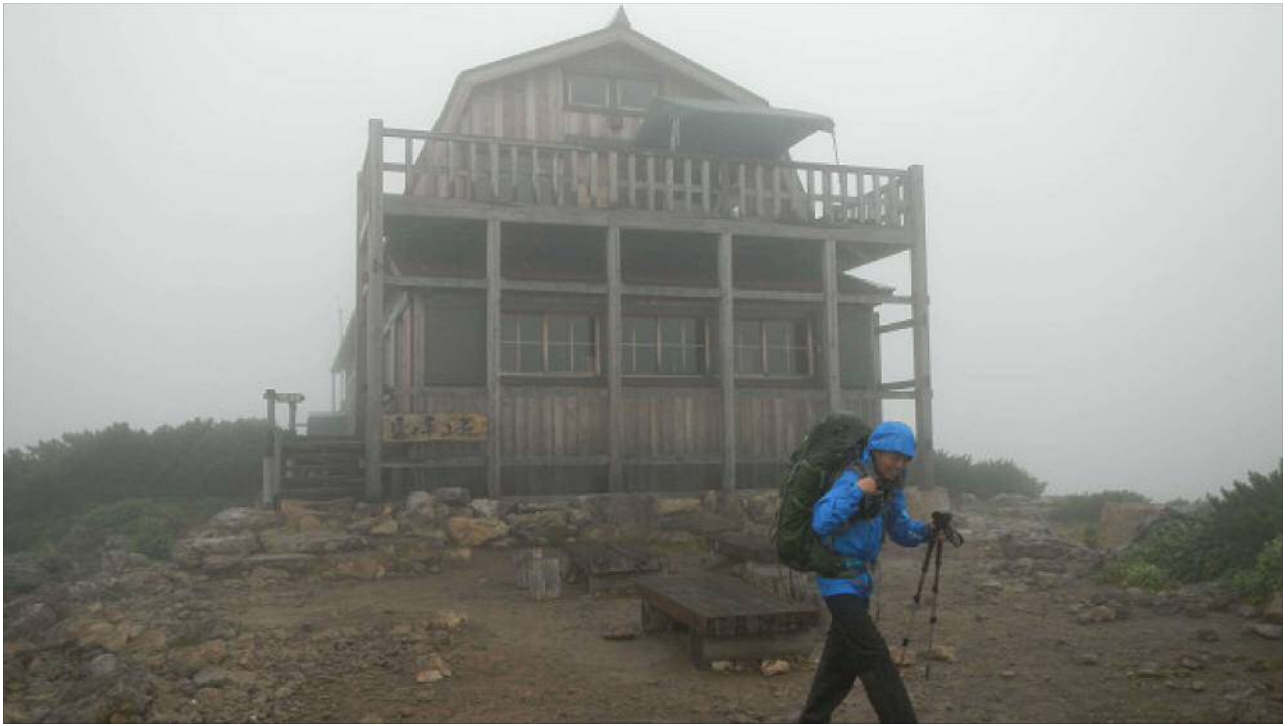
雲ノ平山荘。中は多くの人で賑わっていた。