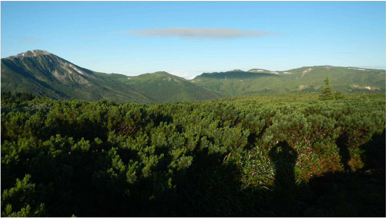
左から黒部五郎岳、赤木岳、北ノ俣岳へと続く稜線。