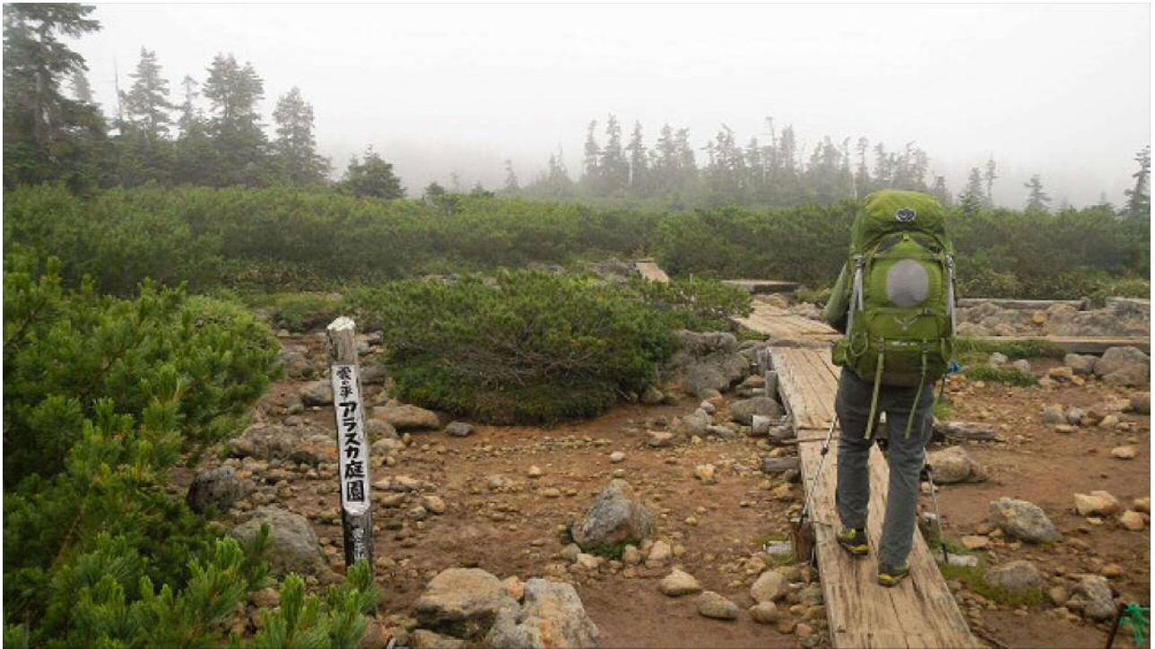
どのあたりがアラスカ風？