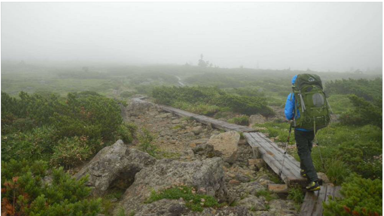
「雲の中の平らな所」を延々と歩く