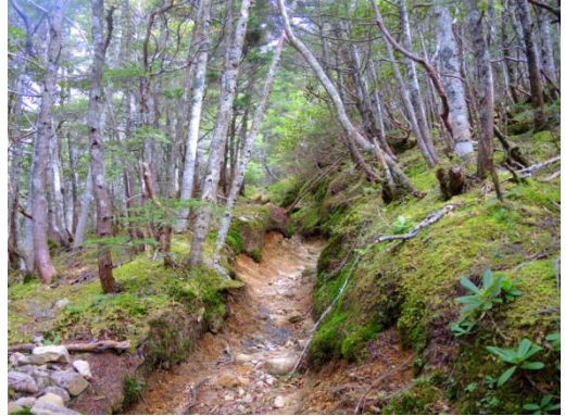
八ヶ岳みたいな苔むした樹林帯