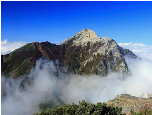
10/7 甲斐駒ヶ岳(アサヨ峰より)