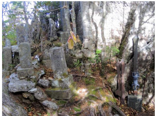
登山道には祠や剣がたくさん。今年は甲斐駒開山200周年で、歴史を感じます