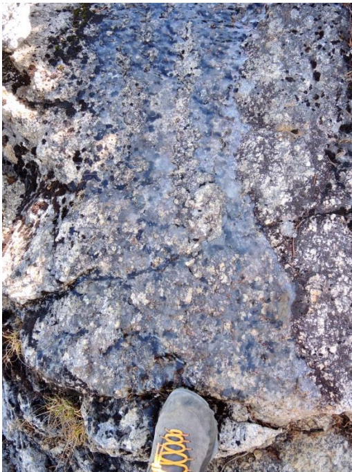
ポカポカ暖かい日差しの中、北側斜面には一部凍っている箇所が(*^^)v♪♪ 去年は私が登った3日後に降雪がありました。今年はどうでしょう…。