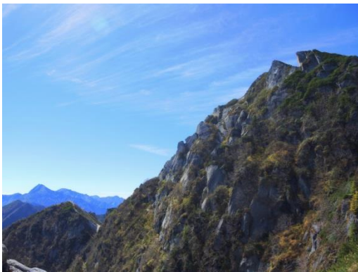
北岳と間ノ岳 甲斐駒の白い岩肌素敵