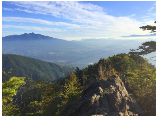
刃渡りと Aさんと八ヶ岳

今回で2回目の黒戸尾根。初回は2015年10月9日だったのでちょうど1年ぶり。リハビリ&体力測定を兼ねて再チャレンジしてきた。