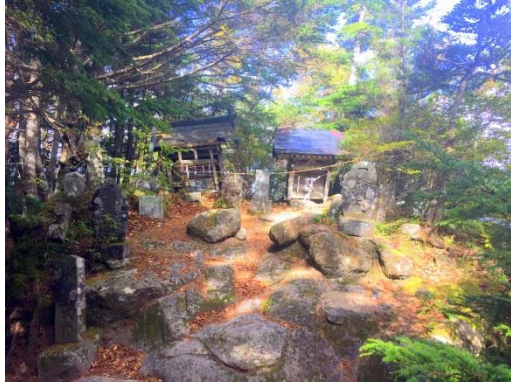
中間地点の刀利天狗