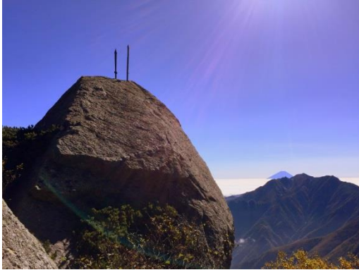
2本の鉄剣、富士山、鳳凰三山