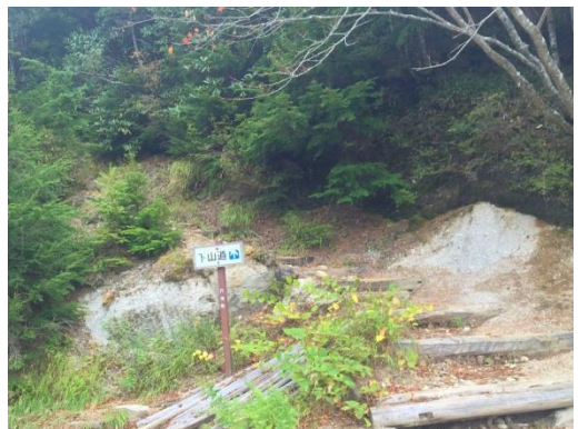
今回一番つらかったのはこの5合目の登り返し。たった100mの登り返しなのにすごく疲れました..