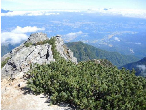
30分の休憩後、下山へ。黒戸尾根…長い。