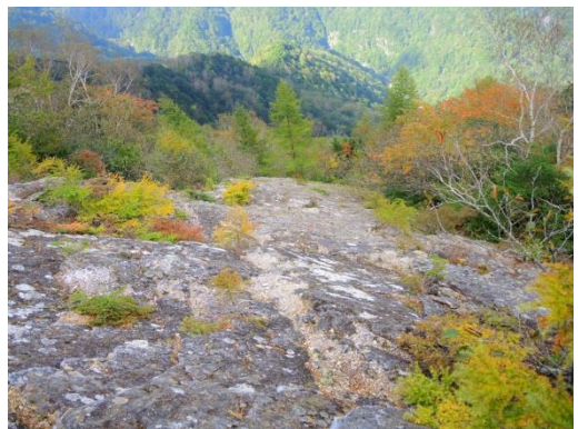
刃渡りあたりから紅葉ちらほら

ずっとAさんがしゃべり続けていた。楽しいからいいのだけど。黒戸尾根中間地点、刀利天狗まで約3時間弱で到着。いいペース♪