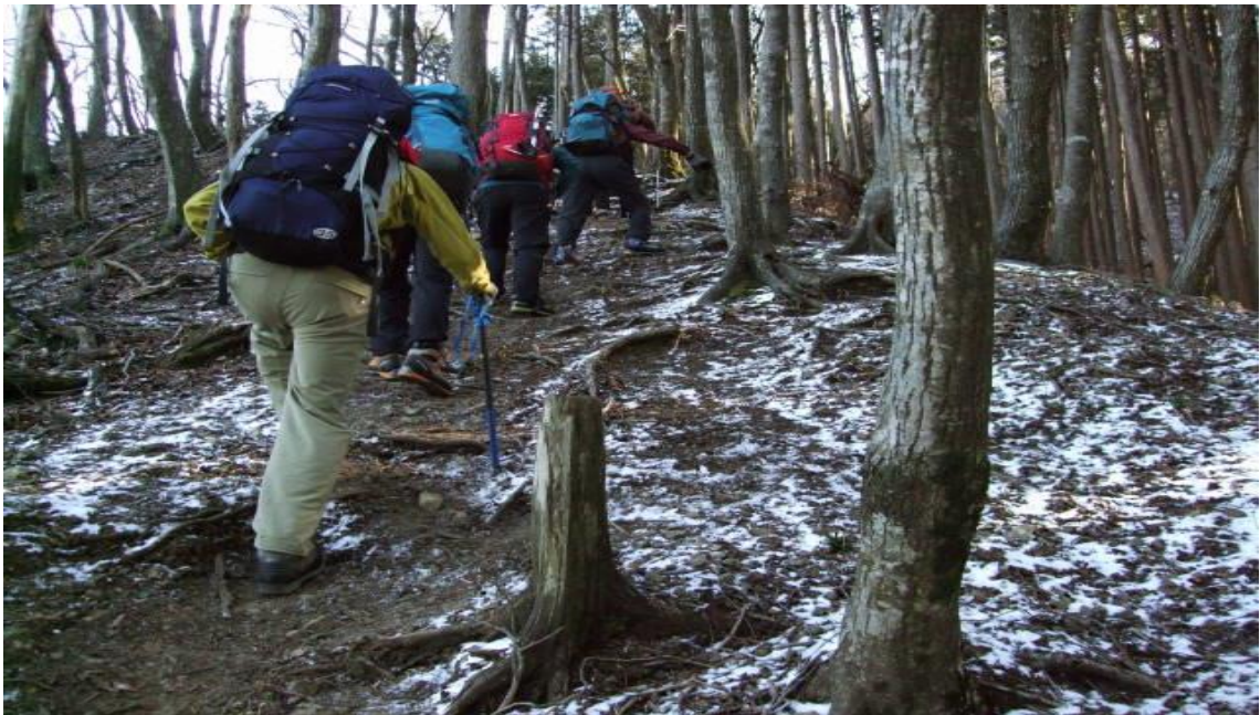
7 合目神社を過ぎたあたりから 1cm~2cmの固まった雪が出始めた。

6 合目~7 合目を過ぎたあたりから針葉樹林帯から広葉樹林帯に日が差し込む明るい登山道となる。また、途中で冬道となるため、8 合目、9 合目の看板は、見られなくなる。