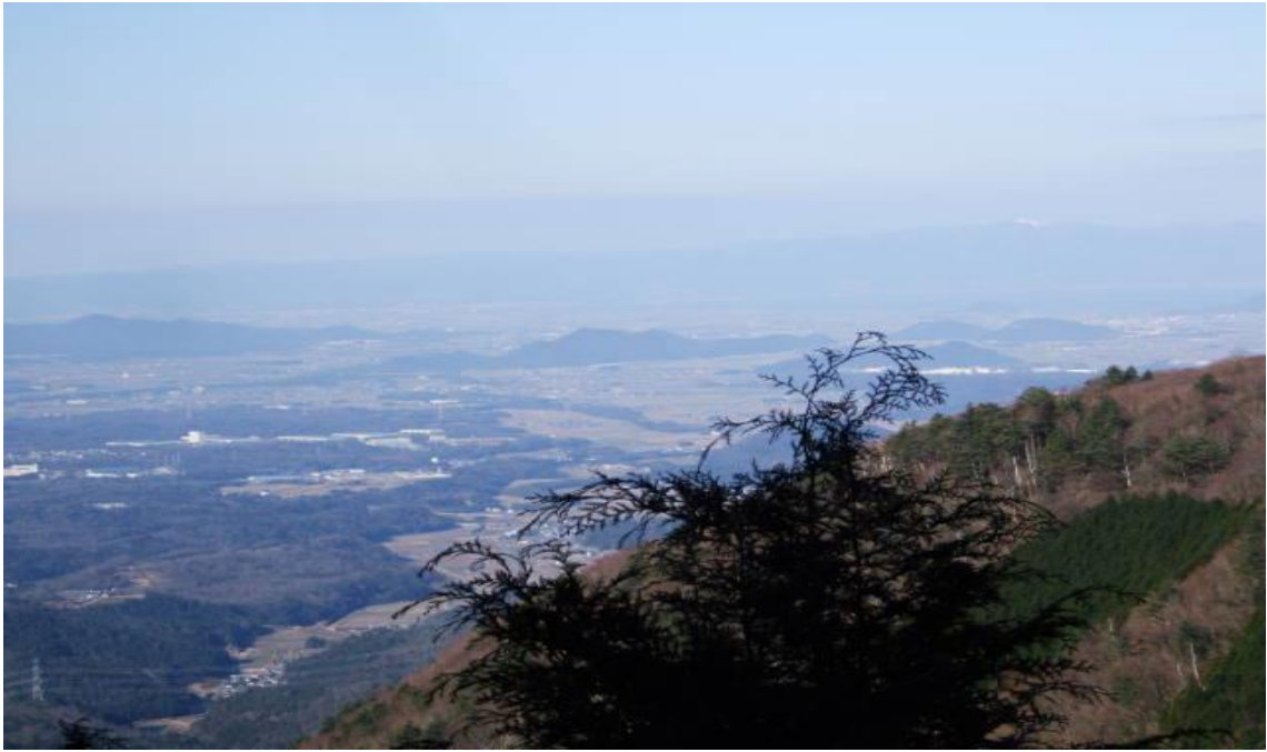
夢咲の鐘から滋賀県側の眺望が望めました。