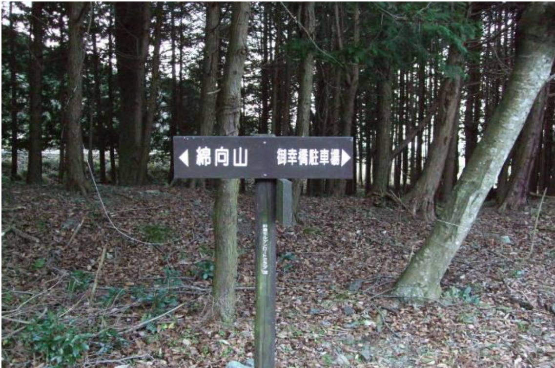
至るところに標識があり分かりやすい登山道です。