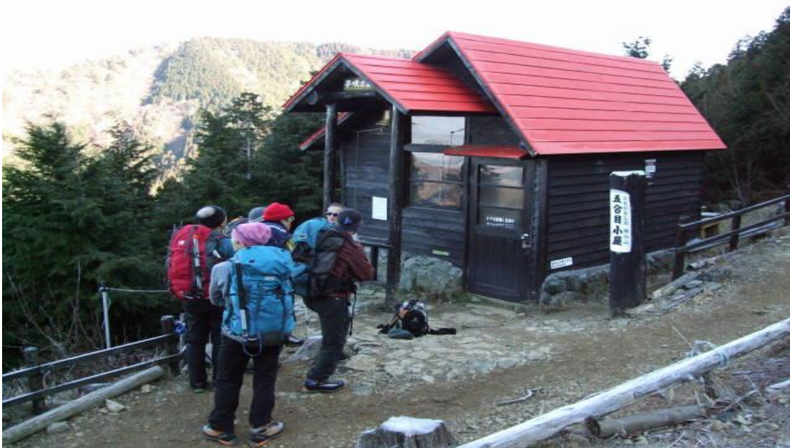
五合目に夢咲の鐘があり無意識に鐘を鳴らしてしまった。小屋の中は、テーブルがあり食事することも可能。何となく北アルプスの船窪小屋の面影があうように感じられる。