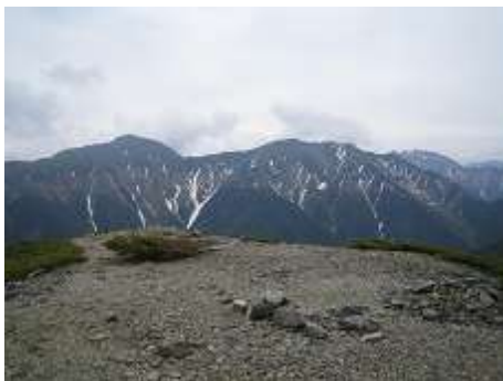
小河内岳から荒川三山