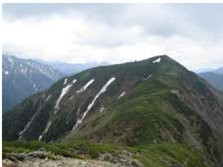
小河内岳を振り返る。