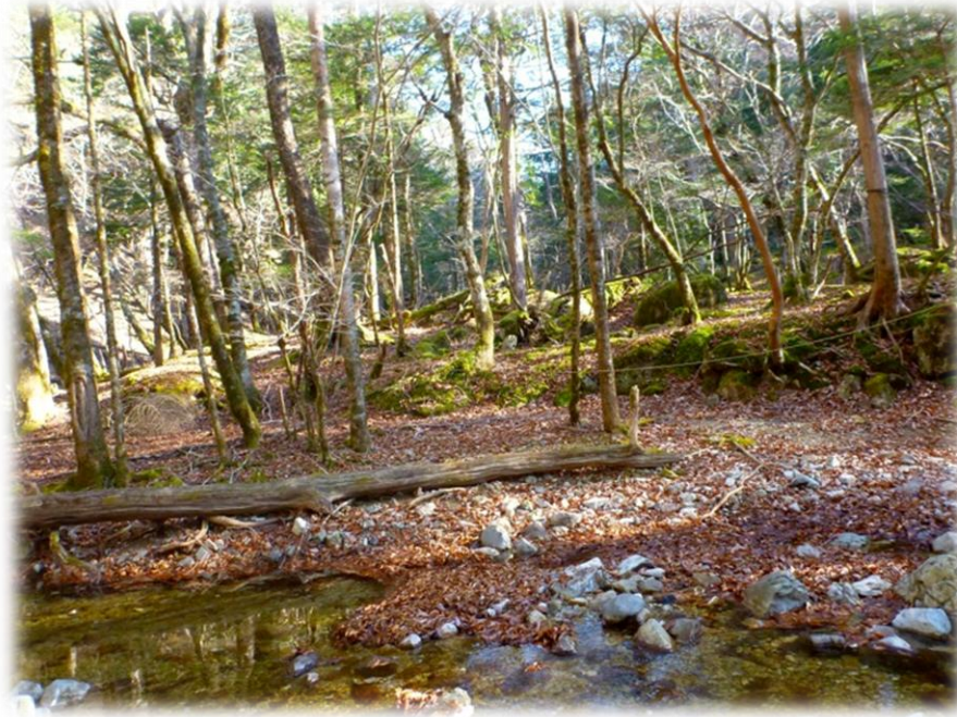
渡渉も何回かある