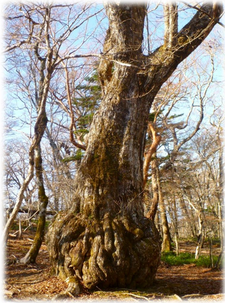
変わった形のみずナラの巨木