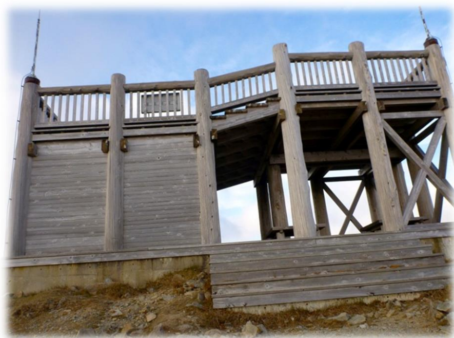
山頂には残念ながら立派すぎる展望台・・・

レクチャーまで1時間あるのでAは初めての大台ヶ原なので東大台ヶ原の日出ヶ岳のピストンに行く事にした。東大台ヶ原は立ち入り制限は無くぐるっと周遊もでき、こちらが百名山でもあり木道のお気軽ハイキングコースで人気の山である。（数年前、記念すべき？私の初百名山でもある）