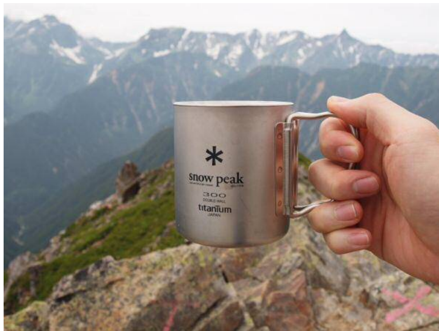
山頂でコーヒーをドリップ&乾杯