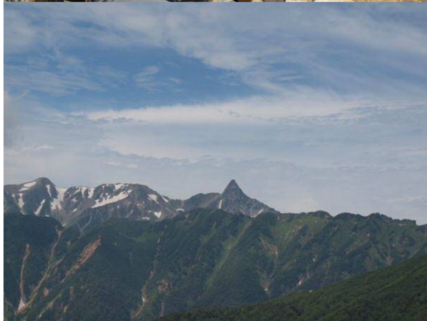
なんとか登頂 槍ヶ岳もくつきり