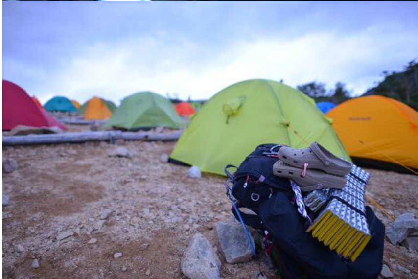
朝食の風景&旅立ちの朝