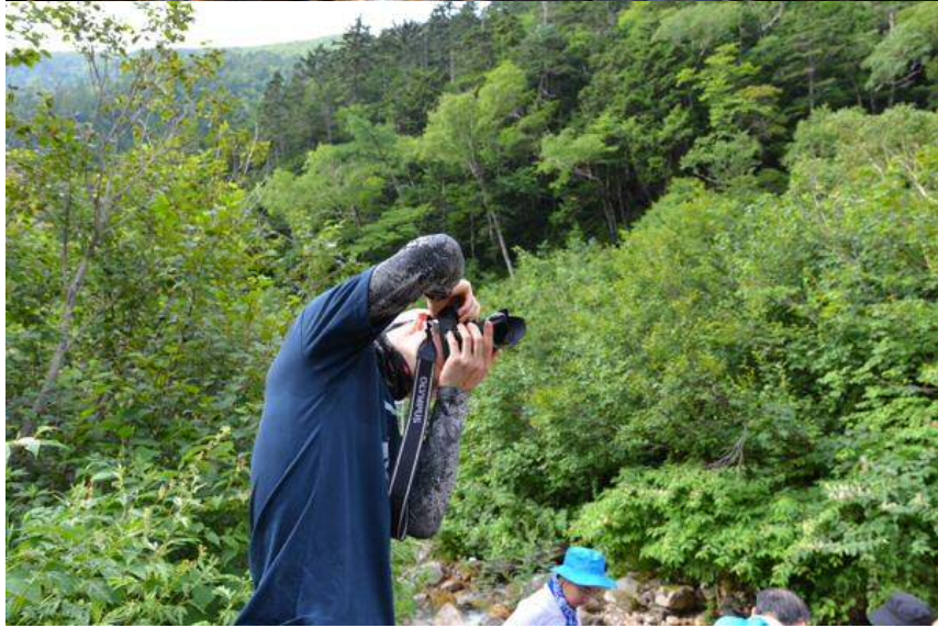
景色も天気も光量もバッチリです まだ体力のこってます