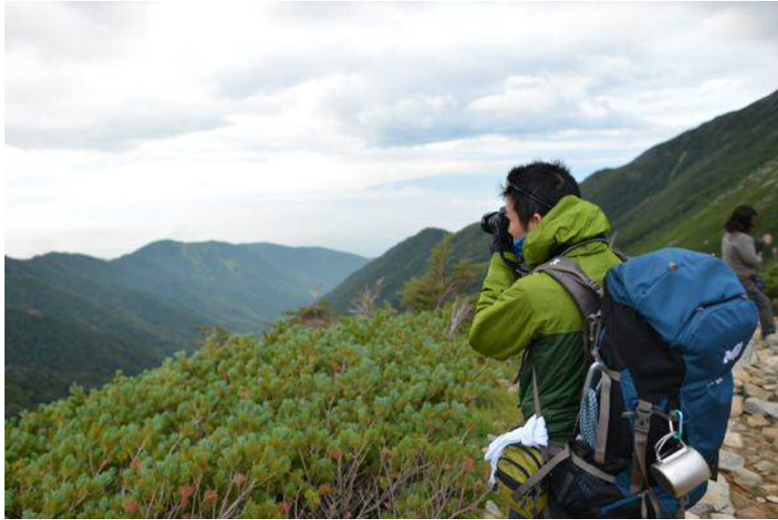
出発前のパシャリパシャリ