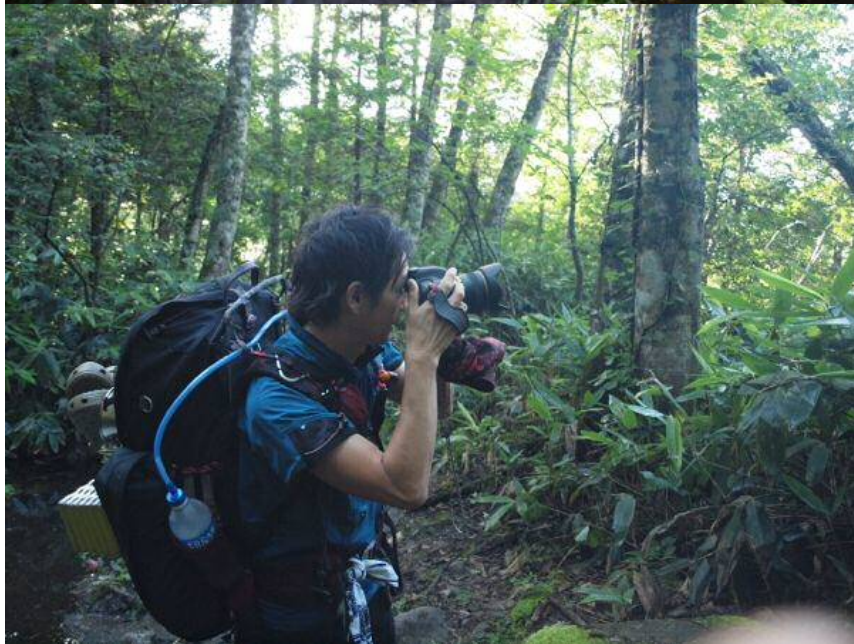
撮影しっぱなしで前に進まない！スタートから30分程度