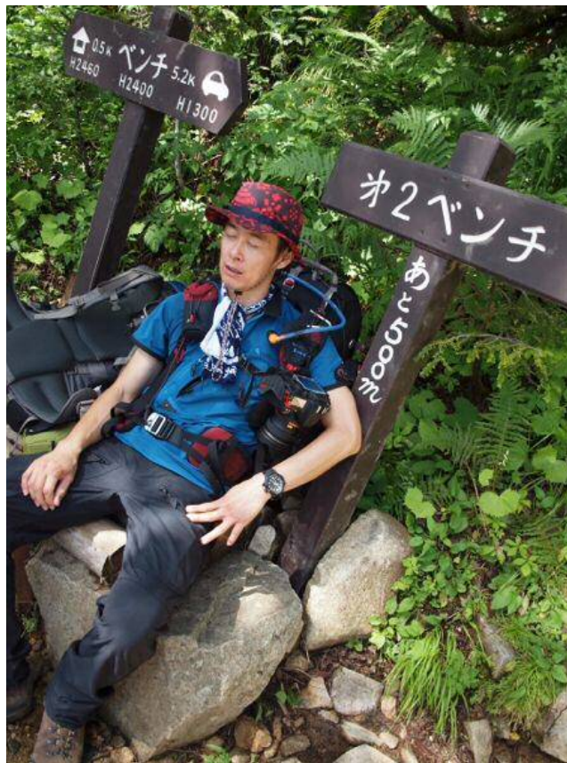
あと少しで秋山限界か??