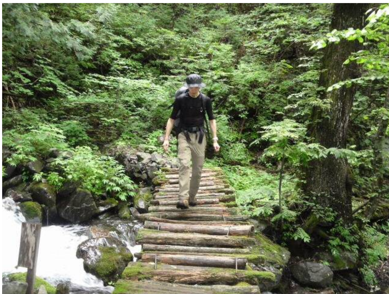
随所にこんな橋が架かっている

コースの半分以上が沢沿いのコースで、樹林下でもあって涼しい。道標も随所にあるので安心だが、距離は長く、このところの大雨で増水していたので、流れも速く、登山道もぬかるんでいる箇所がいくつもあった。