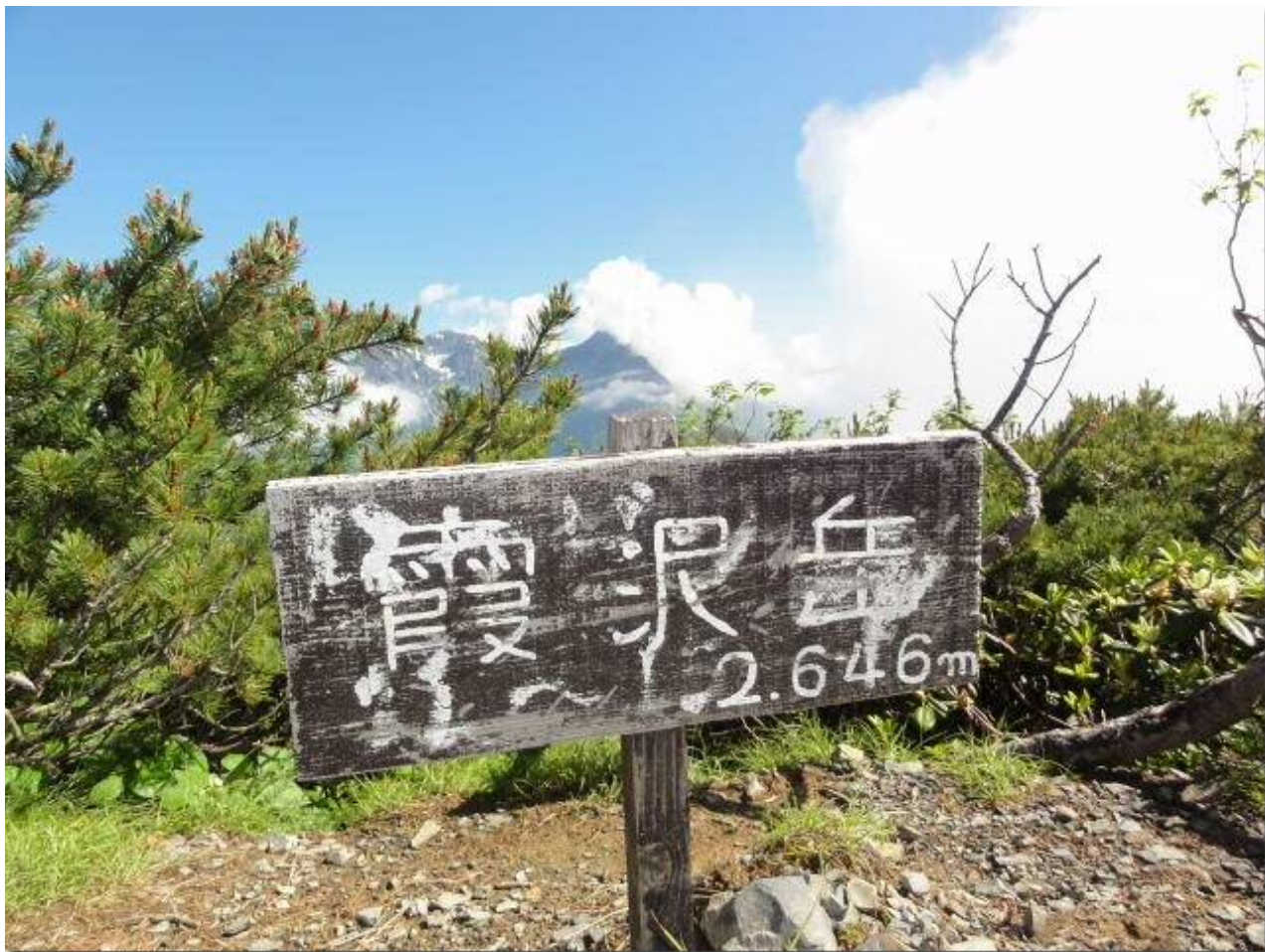
山頂直下にシナノキンバイの花畑が広がる