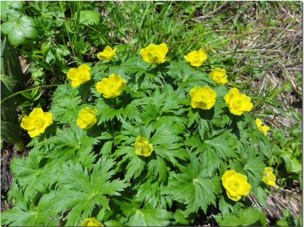
まさに、 たどりついたという感じの霞沢岳

先が長いので、ゆっくりもできず、下山開始。下って、のぼって、下って…… ようやく、徳本峠へ帰ってきた。しばらく、休憩の後、テント撤収して下山。