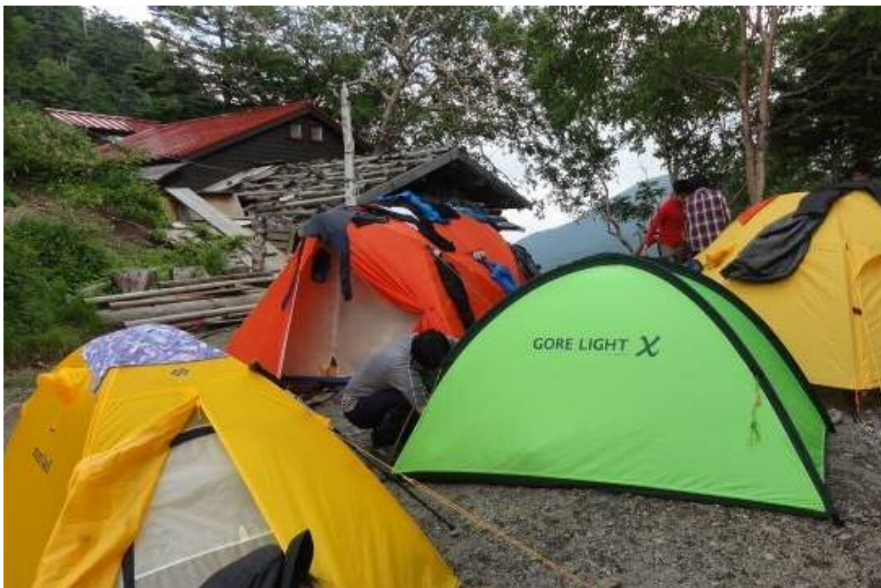
徳本峠のテント場