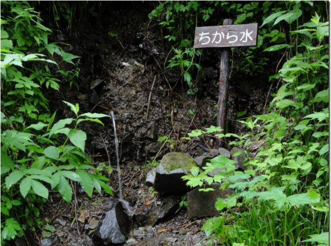
水量多く、冷たくておいしかった