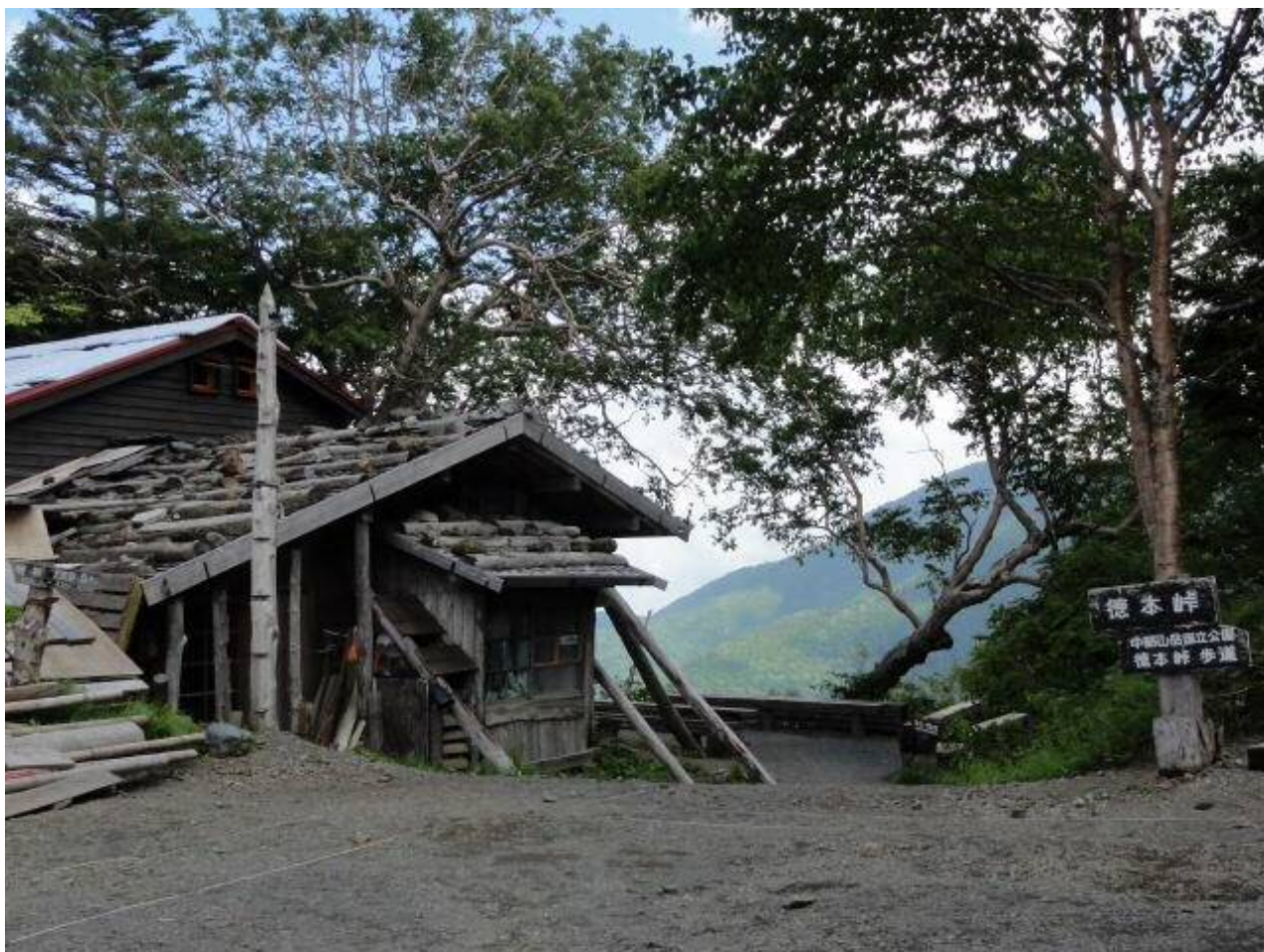
人がなくなった徳本峠

徳本峠から明神までは実に歩きやすい道だった。 梓川沿いを上高地まで歩き、予定通り、16:45のバスで島々まで戻り車を回収。