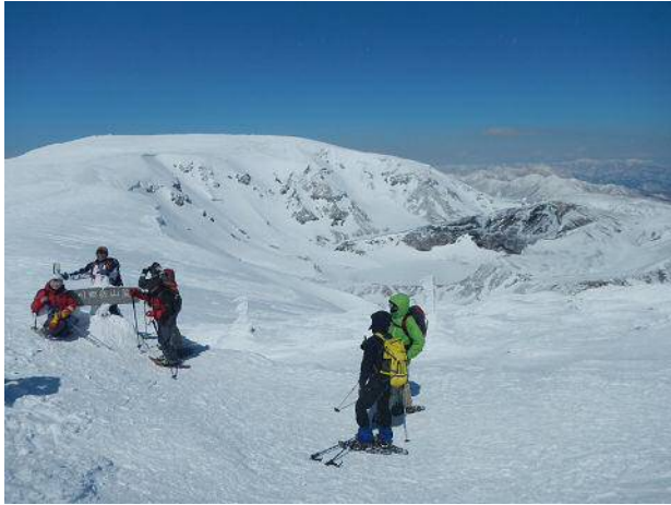
山頂に集う人々。真ん中少し右の平らな丸は御釜とみられる