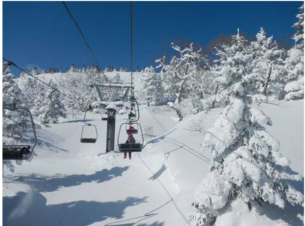
すみかわ第3ヘアリフト

刈田岳の山頂近くまで道路があるが今は冬季通行止。 その道を使ってスキー場から山頂近くまで運んでくれるスノーキャット（雪上車）ツアーがある。 スキーヤーやボーダー、観光客がたくさん乗車していたが山屋は雪上車がならした跡を歩いていく。