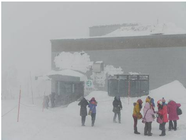
ロープウェイの山頂駅。視界悪し。観光客多し。

下山後は山形県側の蔵王温泉に移動した。翌日に地蔵山経由で熊野岳に向かおうとしたがロープウェイの山頂駅から外に出るとホワイトアウト。登山はあきらめてスキー場のゲレンデで一日中練習した。