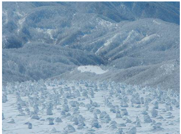
モンスターの集団