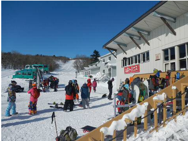
すみかわスノーパーク。ボーダーが多い。

リフレッシュ休暇を利用して東北へ。目的は蔵王のスノーモンスターと山スキーである。 この日は朝から良い天気。宮城県蔵王町のすみかわスノーパークを起点に刈田岳を往復する計画である。 リフトを3本乗ってゲレンデトップへ。他の山スキーヤー、スノーボーダー、ワカンの登山者に混じって出発。