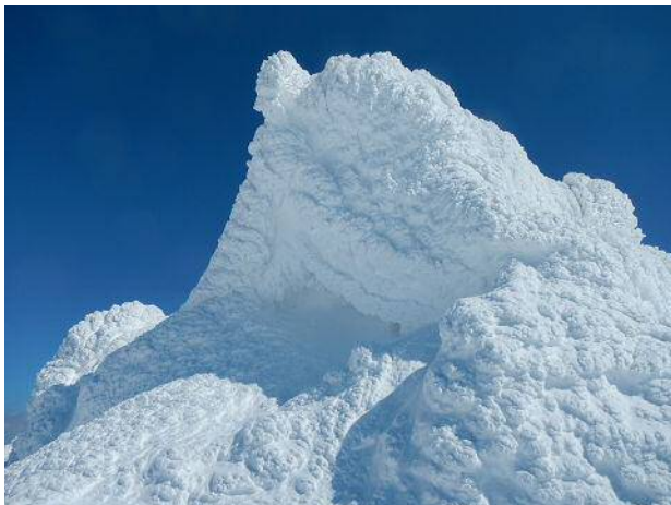
雪の塊となった社殿