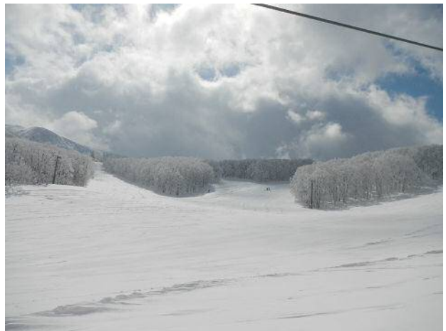
下のゲレンデでは天気は悪くないのだが・・・