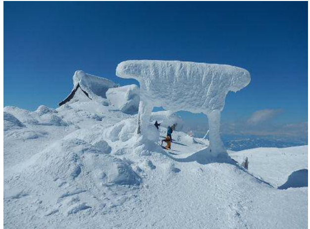
刈田岳の山頂。鳥居が凍てついている。