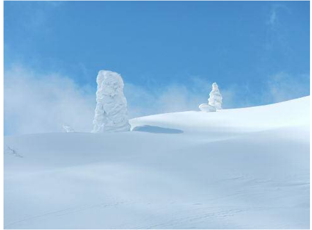
スノーモンスター！

整地された道は山頂の手前100mぐらいで終了。そこからは山頂目指して直登する。 ただし雪面は固いシュカブラでボコボコなのでクローを付けてもスキーでの登高は困難。 スキーは脱いでザックに取り付け、ツボ足で登っていく。