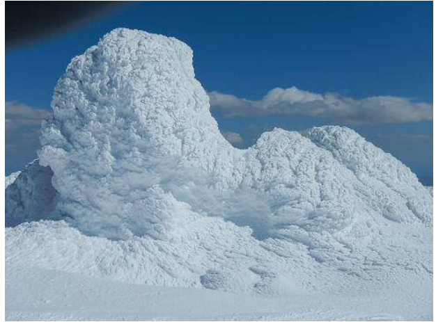
この中には何が入っているのか？

山頂でシールを外して滑降開始。残念ながら納得できる滑りは出来なかった。まだまだ修行が必要と実感した。下りは道路の所々をショートカットしてスキー場に戻った。