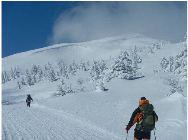
稜線の下に見えるのは雪庇。雪崩の破断面では無い