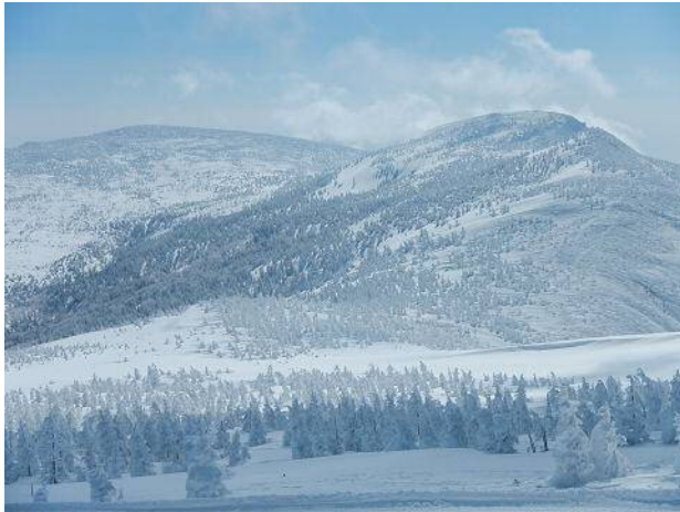
刈田岳山頂付近からの前岳の眺め

整地された道は山頂の手前100mぐらいで終了。そこからは山頂目指して直登する。 ただし雪面は固いシュカブラでボコボコなのでクローを付けてもスキーでの登高は困難。 スキーは脱いでザックに取り付け、ツボ足で登っていく。