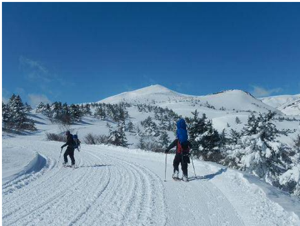
正面真ん中のピークが目指す刈田岳

刈田岳の山頂近くまで道路があるが今は冬季通行止。 その道を使ってスキー場から山頂近くまで運んでくれるスノーキャット（雪上車）ツアーがある。 スキーヤーやボーダー、観光客がたくさん乗車していたが山屋は雪上車がならした跡を歩いていく。