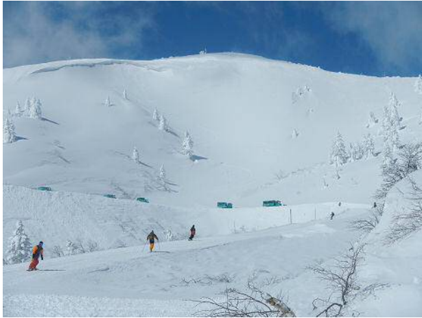
スノーキャット隊が戻ってくる