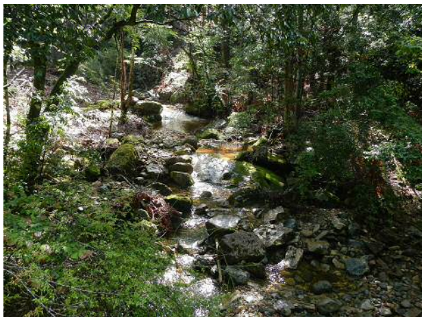
橋の上から見たユヤノ沢出合