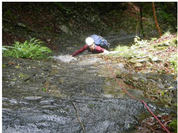
大きいホールドが少ない小滝を登る