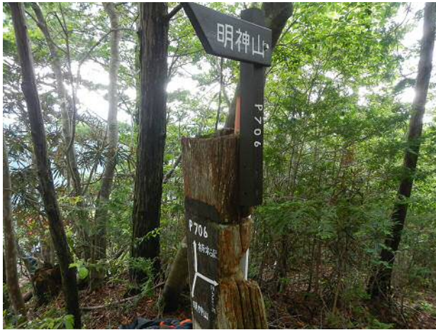
標高706m地点の標識。我々は「ほうらい湖」の方向に進んだ。

下山の登山道は標高600mあたりの植林帯で少し不明瞭になるが、そこ以外は明瞭。 今回、他のパーティーには全く出会うことは無かった。