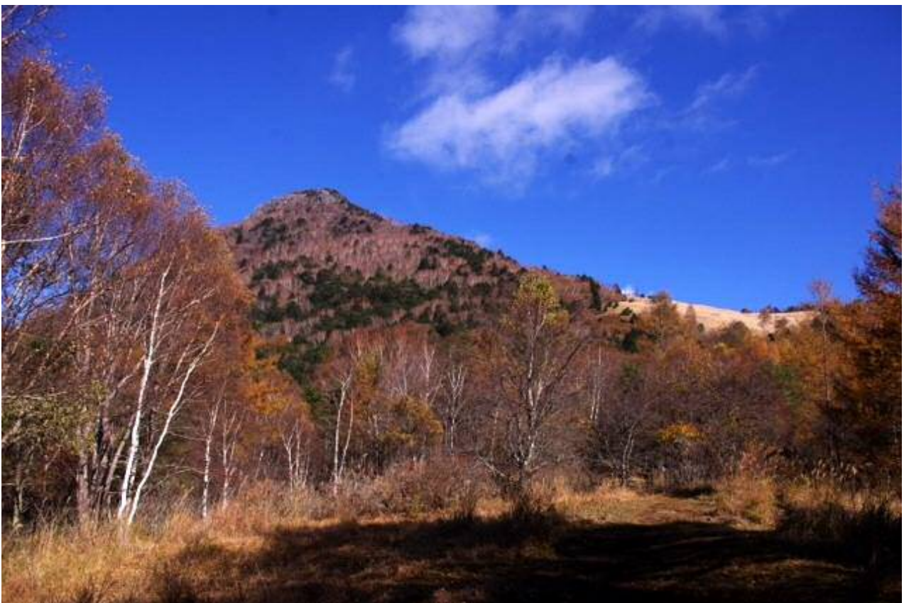
国師ヶ原へ至ると山頂が見えてくる。

ルート上の植生も多様で変化があり、山頂直下の岩登りも含め、思っていた以上に楽しめた。 国師ヶ原で多数の鹿を目撃。人を恐れる風もなく悠々と草を食んでいた。