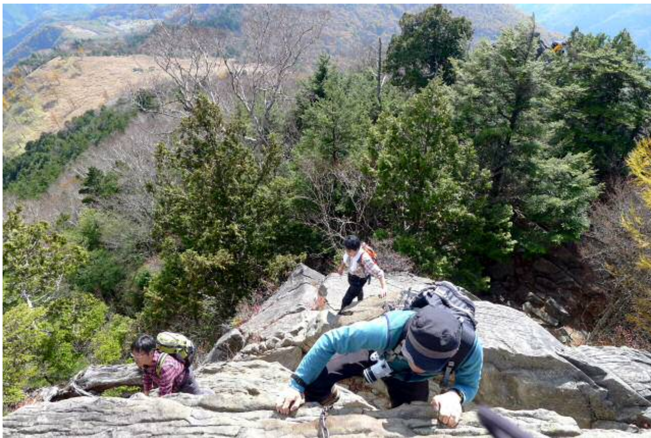
山頂に近づくにつれ、山の様相が変わる。