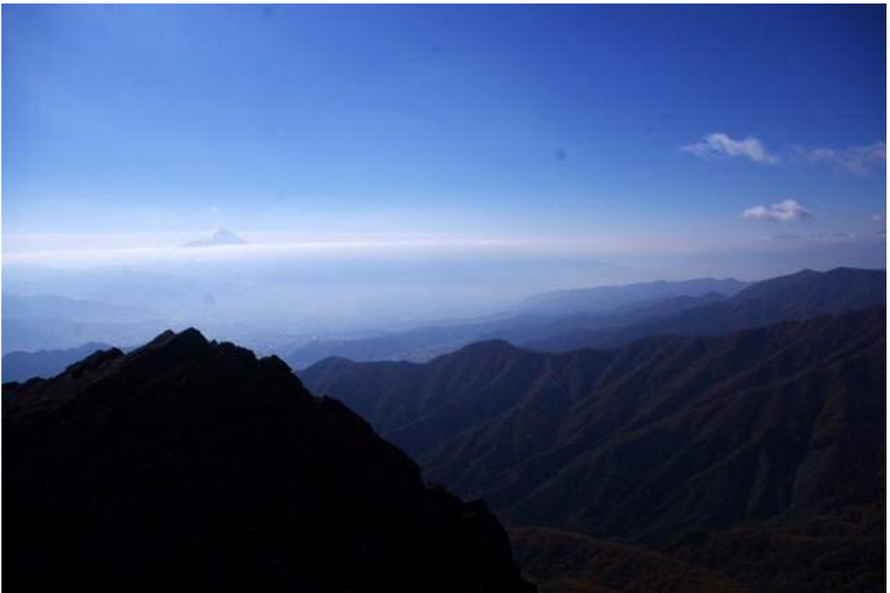
富士山も良く見えた。