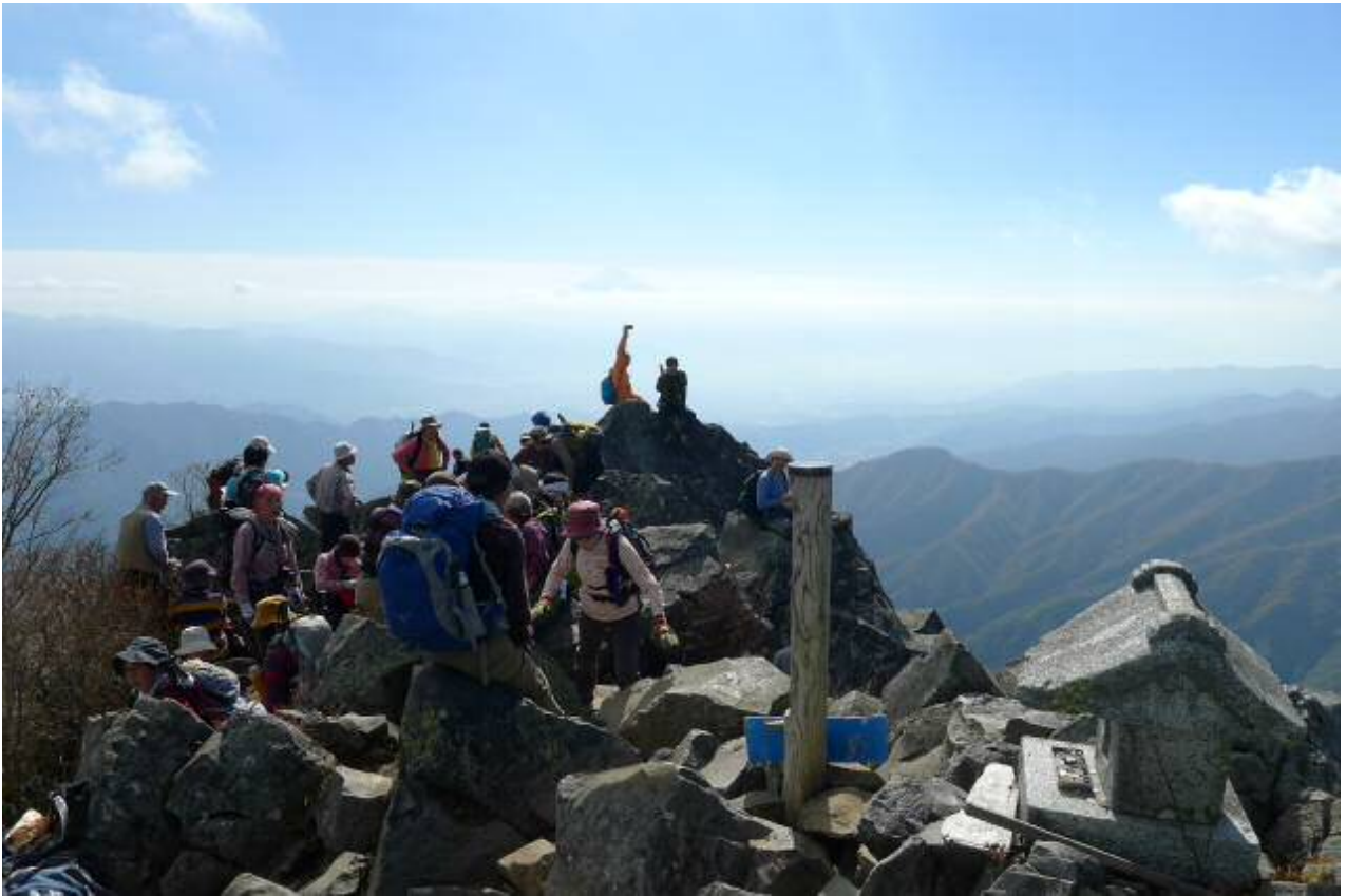
団体さんで賑わう山頂。