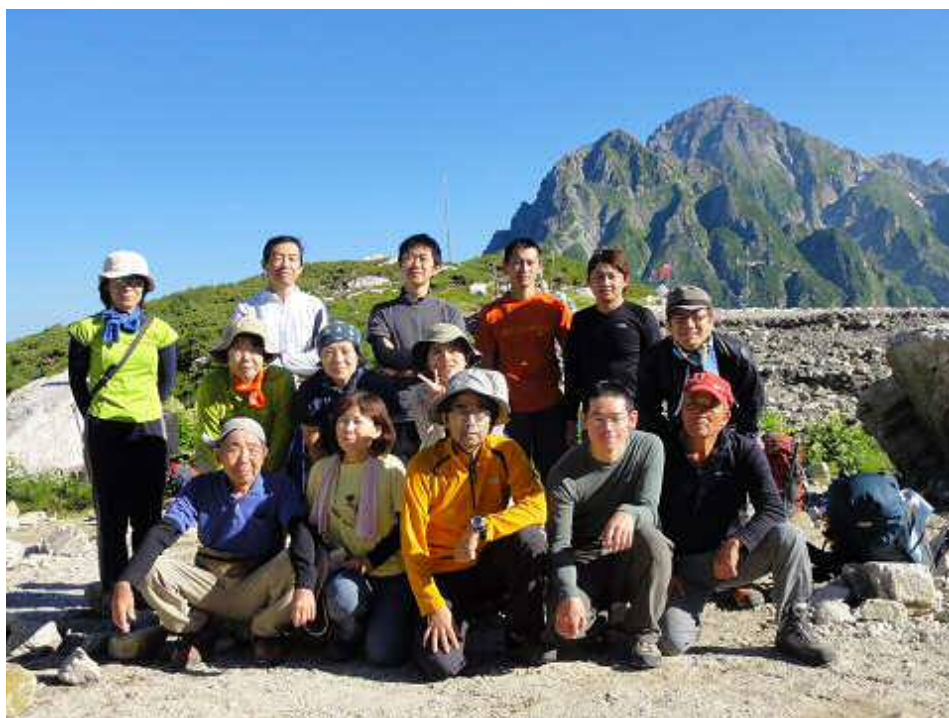
最終日も快晴。バックはもちろん劔岳