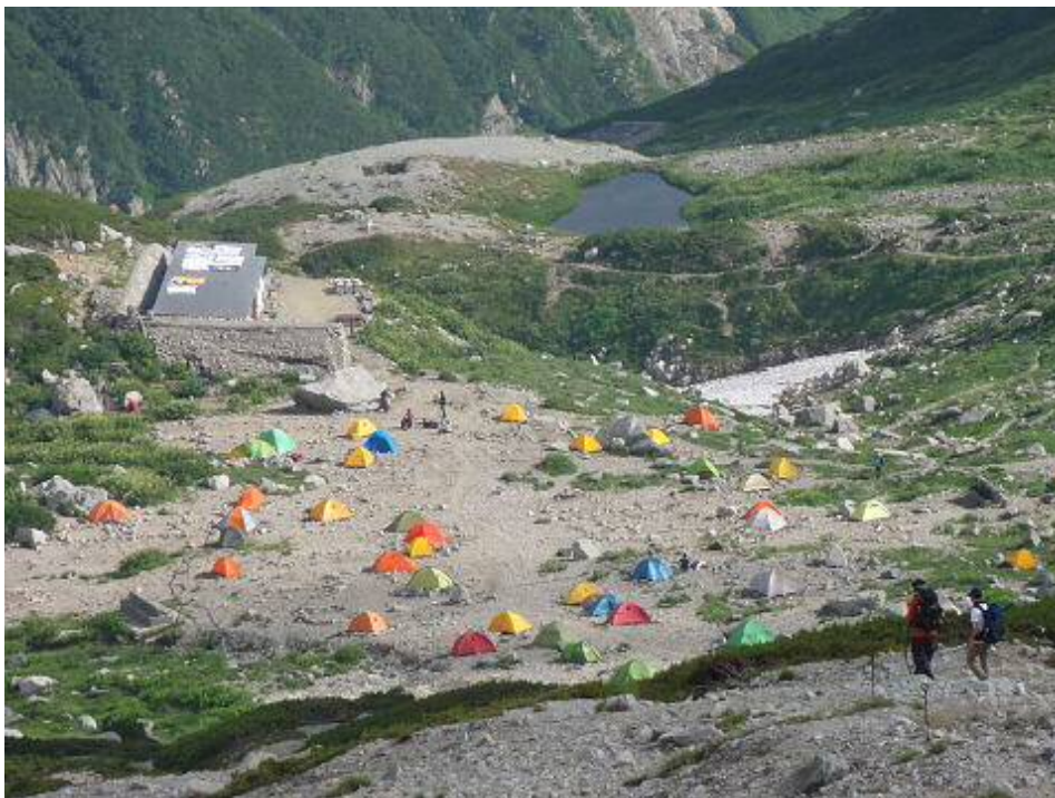
劔沢キャンプ用を見下ろす