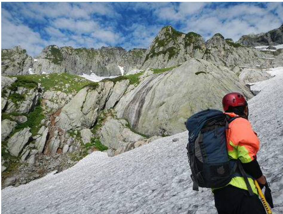
長次郎雪渓の登り。熊の岩を見上げる