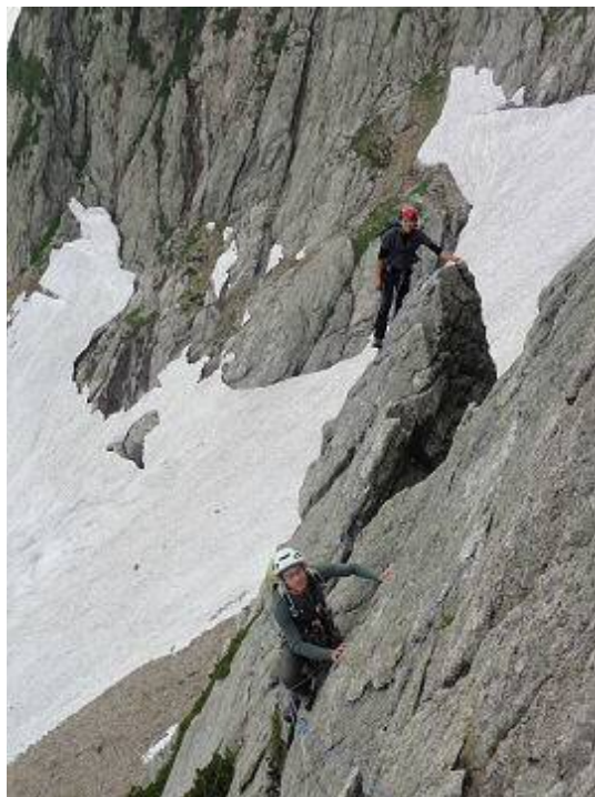
劔稜会ルート4ピッチ目。高度感があるリッジのクライミング