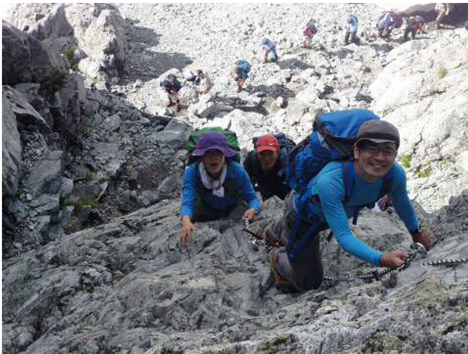
劔岳山頂を目指す。ここは「カニのタテバイ」