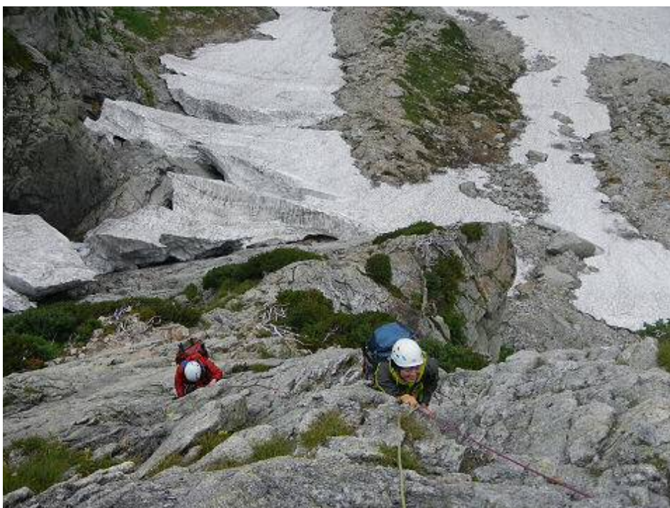
八ツ峰VI峰Cフェース剣稜会ルート1ピッチ目