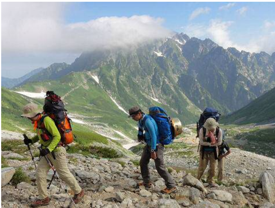
ベースキャンプを撤収。劔岳を後にする