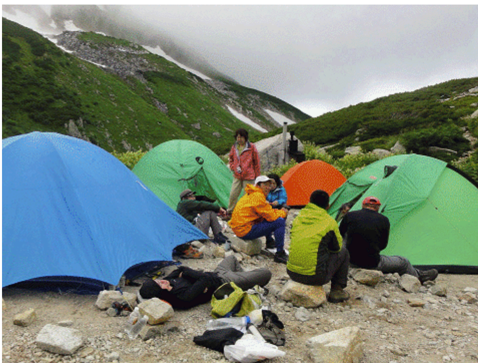
ベースキャンプでくつろぐメンバー