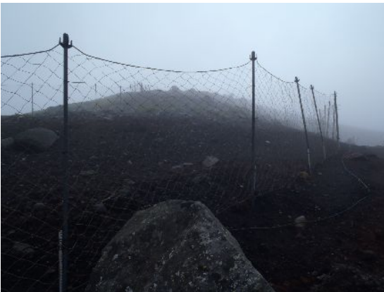
稜線まで続く防護柵。登山道の雰囲気が変わ ったように感じた