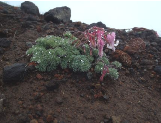
雨露をつけたコマクサ。硫黄山荘～稜線の 辺りに群生してた