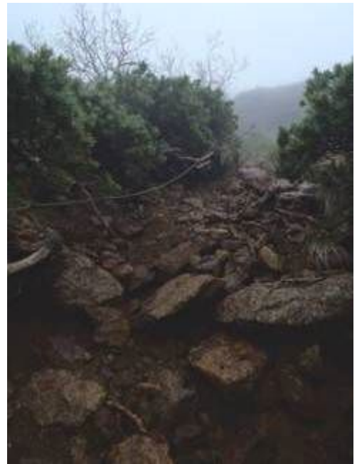
御小屋尾根の下り。悪い