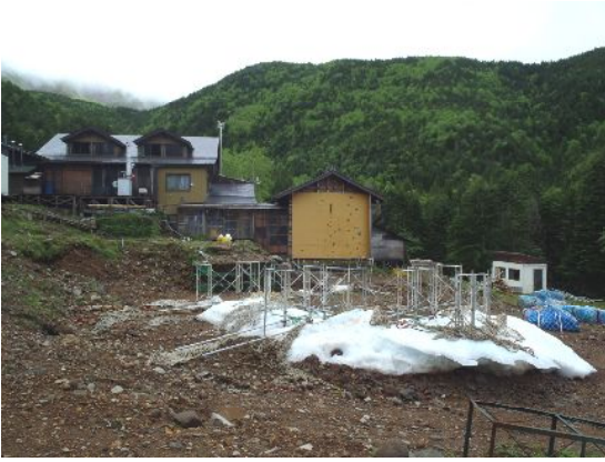
鉱泉にはアイスクャンディの残骸が残る