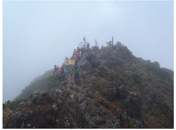
山頂は占拠されていた