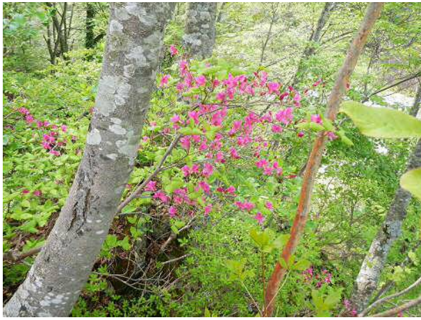
ツツジの赤紫が新緑の中に映える。