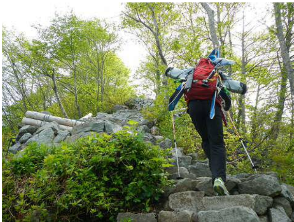
別当出合から砂防新道に入っても雪はなかなか出てこない。