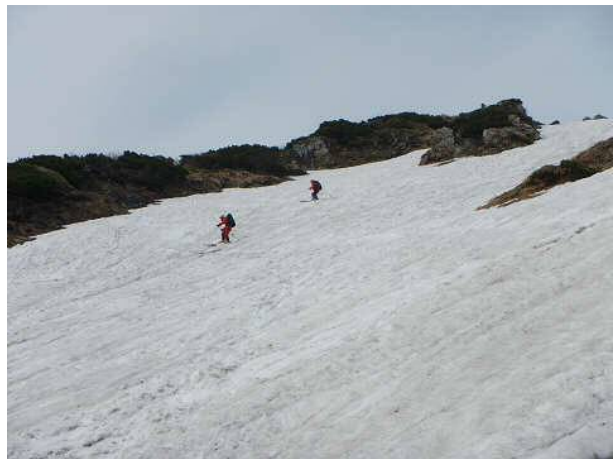
急斜面でも程良い抵抗のザラメ雪なので滑りやすい。

<タイム> 市ノ瀬7:00 - 別当出合8:35 - 碁之助避難小屋11:20~11:40 - 黒ボコ岩13:20 - 室堂13:50~14:10 - 黒ボコ岩14:35 - 別当出合16:55 - 市ノ瀬18:10