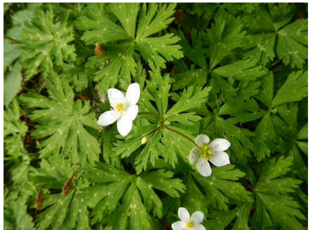
ハクサンイチゲが咲き始めていた。