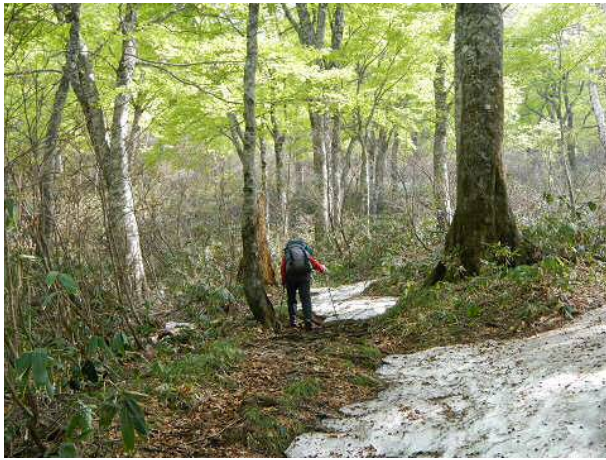
標高1470mあたり。雪が出てくる。