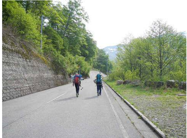
別当出合まで約6kmの歩き。自転車の人もかなりいた。