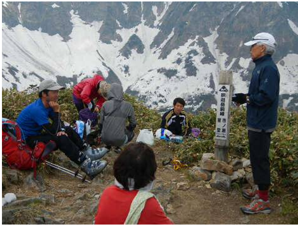
白山釈迦岳前峰にて

<タイム> 市ノ瀬6:30-登山口8:00-白山釈迦岳前峰10:55~11:25-登山口12:55-市ノ瀬14:00