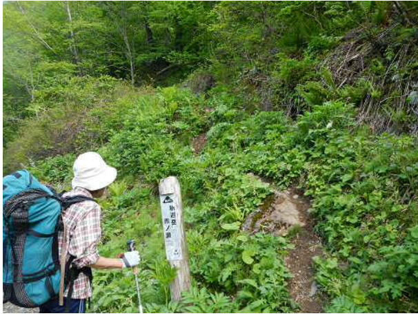
市ノ瀬から1.5時間歩いて釈迦岳の登山口に至る