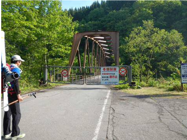
市ノ瀬駐車場を出てすぐに通行止めのゲートが・・・

別当出合まで車で入れなかったことあって、市ノ瀬~室堂の往復22kmのうち17kmはスキーを背負って歩き、スキー滑走が出来たのは2.5kmに留まった。