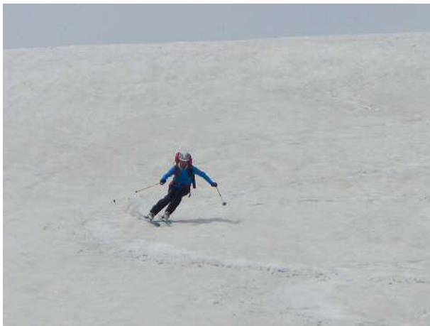
おまかねの滑降。侍の華麗な滑り。