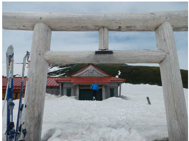
室堂の白山神社。周囲にはまだ1m程度の積雪がある。