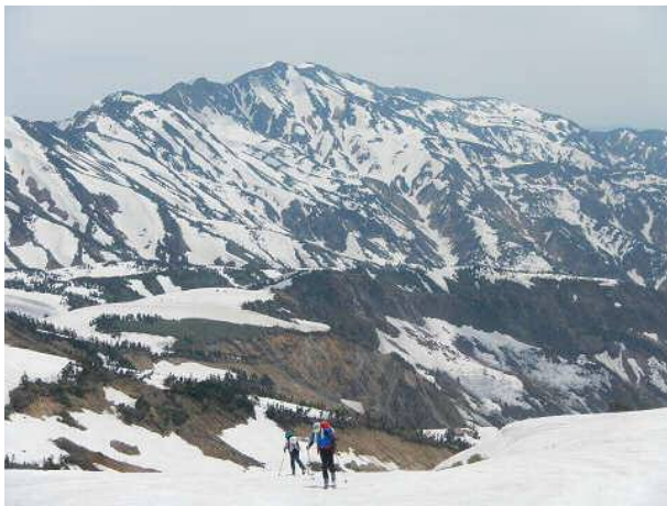
シール登高中。バックは別山。