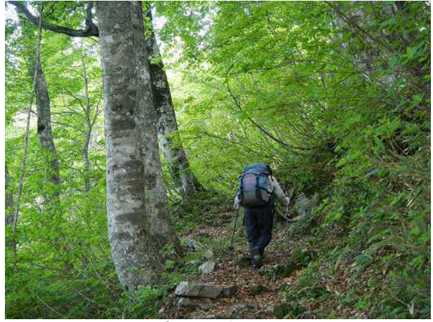
ブナの新緑が美しい。