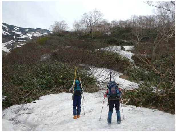
標高1650mあたり。ようやく雪がつかってきた。