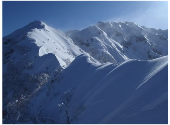
ここでロープを出す