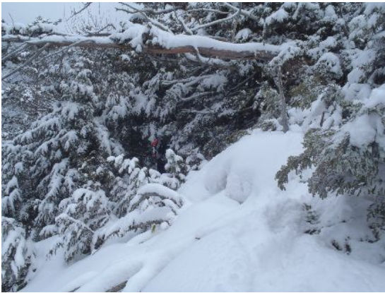
歩きにくい樹林帯