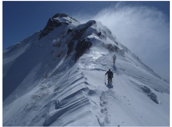
強風のなかを進む