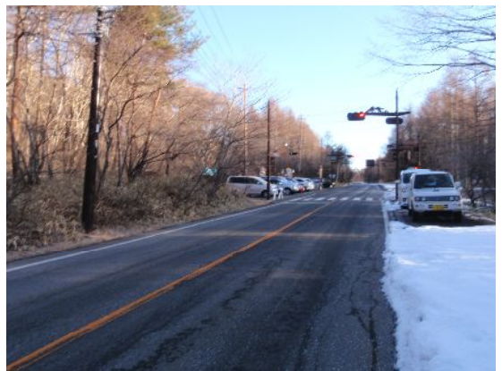
朝の駐車風景…右側のスペースは歩道