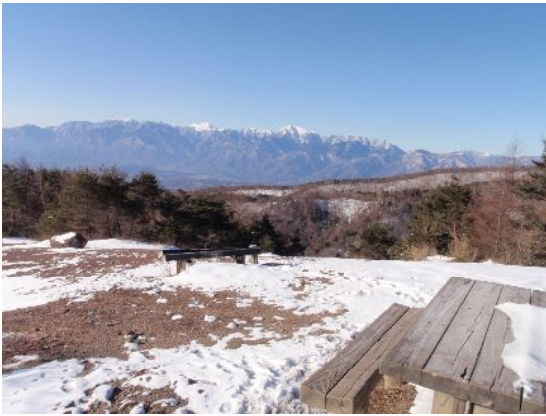
天の河原 ～登山口から1ピッチ弱でこの展望！