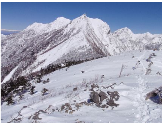
三ツ頭まで登るとやっと権現岳が見える