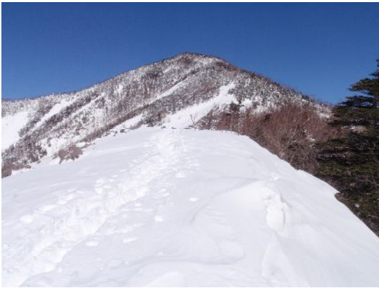
前三ツ頭から望む三ツ頭